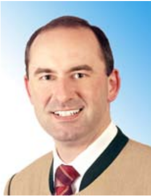
Hubert Aiwanger Landesvorsitzender Stadtrat und Kreisrat

Wir leben noch in relativem Wohlstand. Trotzdem fürchtet die Mehrheit der Bevölkerung, dass wir in Zukunft unseren derzeitigen Lebensstandard nicht halten können. Geht es der nächsten Generation besser oder schlechter als uns? Tatsache ist, dass schon heute vieles „nicht mehr bezahlbar“ ist oder „nicht mehr erhalten werden kann“ - auch in Bayern! Schulen werden geschlossen, weil kleine Klassen angeblich „zu teuer“ sind. Lehrer sind knapp, obwohl wir weniger Schüler haben als früher. Es leben heute mehr Analphabeten unter uns als vor 20 Jahren. Ländliche Gebiete verlieren Einwohner, Wohnraum steht leer. Die Straßen sind heute in einem schlechteren Zustand als vor 10 Jahren. Bahnstrecken werden stillgelegt. Krankenhäuser und Hausarztpraxen auf dem Land „müssen geschlossen werden“. In vielen Branchen sinkt das Lohnniveau, ein Verdienst reicht oft nicht mehr aus, um eine Familie zu ernähren. Die öffentliche Verschuldung steigt trotz zunehmender Steuerlast. Eigentum wird immer stärker belastet. Sozialverbände berichten von zunehmender Armut, Perspektivlosigkeit und Vereinsamung. Es geht nicht darum, den Teufel an die Wand zu malen, es ist aber auch zu oberflächlich, zu sagen: „Bayern ist Spitze“. Es geht heute darum, Fehlentwicklungen rechtzeitig zu erkennen, politisch aufzugreifen und über Parteigrenzen hinweg gemeinsam Lösungen zu suchen, um die Zukunft unserer Gesellschaft zu sichern.