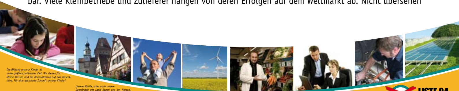
Die Bildung unserer Kinder ist unser größtes politisches Ziel. Wir stehen für kleine Klassen und die Konzentration auf das Wesentliche. Für eine gesicherte Zukunft unserer Kinder!

Wirtschaftsnachrichten konzentrieren sich in erster Linie auf die „global player“ mit Weltruf. Wir brauchen diese Unternehmen und tun gut daran, den Wirtschaftsstandort so zu gestalten, dass sie uns nicht den Rücken kehren. Ihre Exporterfolge und Innovationen sind für den Wohlstand unserer Gesellschaft unverzichtbar. Viele Kleinbetriebe und Zulieferer hängen von deren Erfolgen auf dem Weltmarkt ab. Nicht übersehen