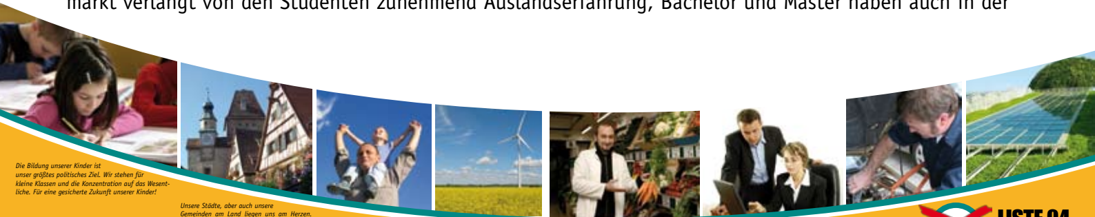
Die Bildung unserer Kinder ist unser größtes politisches Ziel. Wir stehen für kleine Klassen und die Konzentration auf das Wesentliche. Für eine gesicherte Zukunft unserer Kinder!

Die Internationalisierung der letzten Jahre hat auch vor den Hochschulen nicht Halt gemacht. Der Arbeitsmarkt verlangt von den Studenten zunehmend Auslandserfahrung, Bachelor und Master haben auch in der