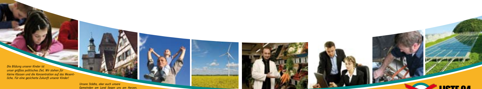
Die Bildung unserer Kinder ist unser größtes politisches Ziel. Wir stehen für kleine Klassen und die Konzentration auf das Wesentliche. Für eine gesicherte Zukunft unserer Kinder!

Eine Verwaltungsreform ohne Einbeziehung der Betroffenen („wer den Teich trockenlegen will, darf mit den